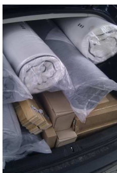
Postelami a matracmi sme zaplnili celý kufor

Naším klientom v rámci projektu neustále hľadáme vhodné a cenovo dostupné bývanie. Väčšinou ide o ubytovne s nízkym štandardom, prenájom bytov si dovoliť nemôžu.