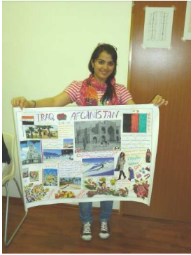
Projekt - Moja krajina -na hodine slovenskeho jazyka